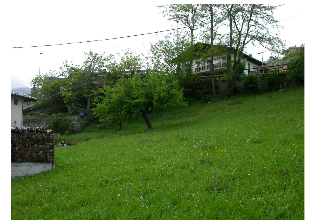
SCORCIO AREA DESTINATA AD AUTORIMESSA COLLETTIVA