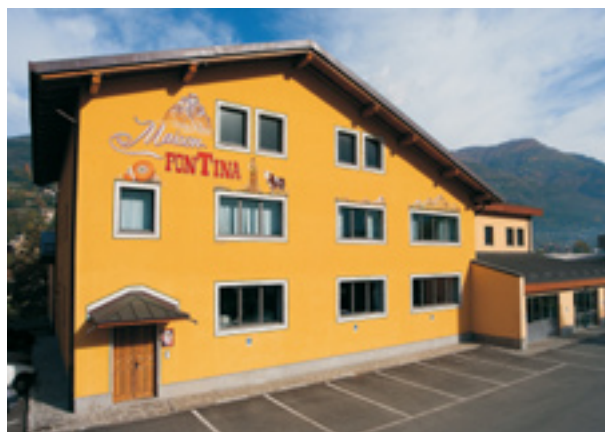
La sede di Saint-Christophe oggi...

Il pranzo è stato allietato da un intramezzo fatto dalla Fédération valdoténa téatro populéro che con le sue gag ha fatto divertire tutti gli invitati. A metà pranzo gli attori hanno interpretato l'arrivo di un famoso studioso svizzero esperto di produzione di formaggi che ha spiegato ai presenti come la musica influisce sulla produzione del latte e del formag-