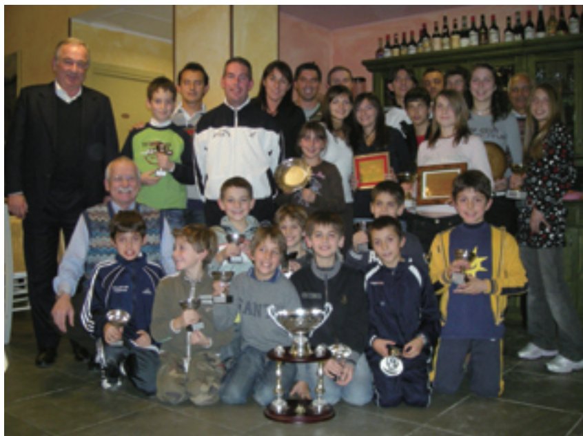
Festa del Tennis 2007