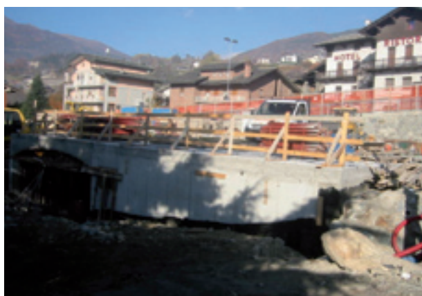
Autorimessa in località Bret

- progettista Geom. Communod Renato Studio CO.PA.CO (consegna lavori 28/05/07).