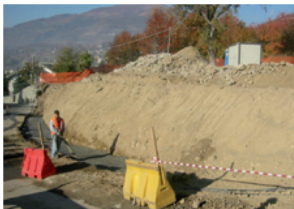
Strada interna in località Bagnère