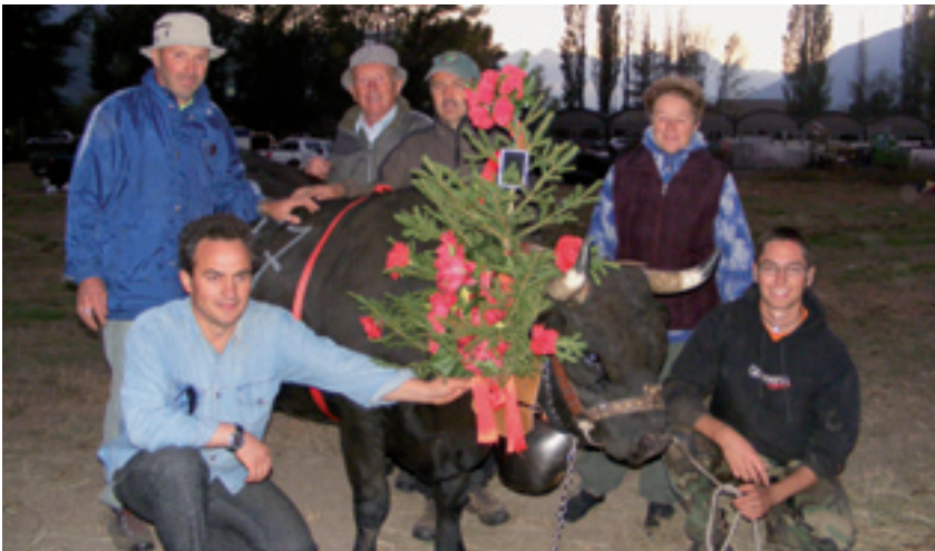
La Reina di Crétier Aurelio

Gli allevatori di Saint-Christophe ringraziano l'amministrazione comunale, il gruppo degli alpini di Saint-Christophe per il servizio buvette, i pompieri volontari per il servizio svolto e tutti coloro che hanno collaborato per la buona riuscita della manifestazione.