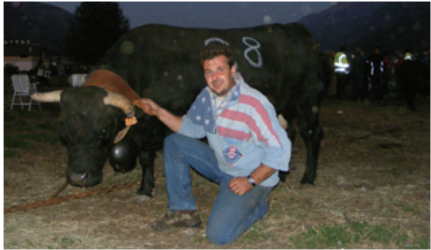
La Reina di Roberto Rosaire

In prima categoria le reine di Saint-Christophe erano 18, tra le quali figurava anche Nemica di Aurelio Crétier (720 kg) classificatasi poi terza; in seconda categoria le