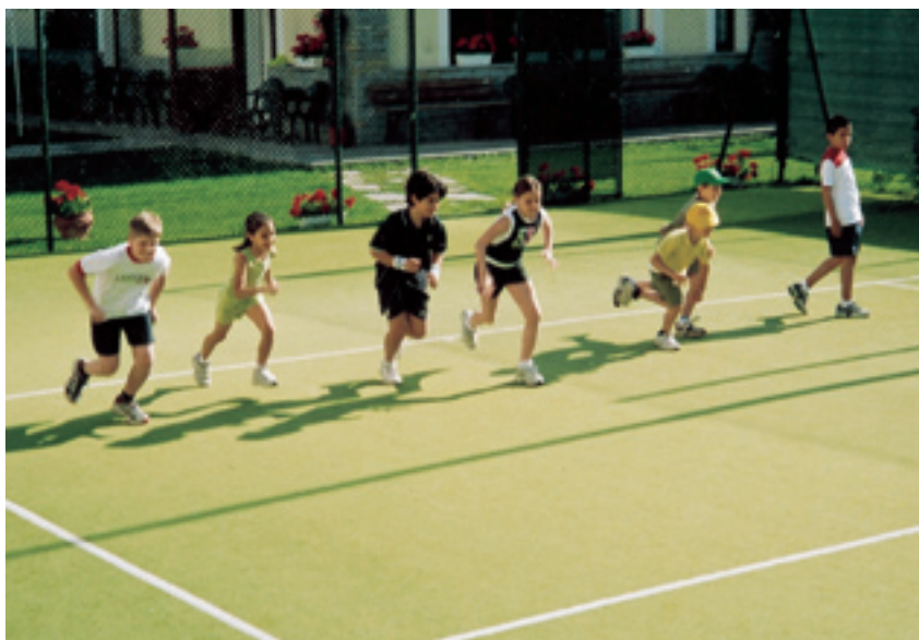
I ragazzi ai Centri Estivi