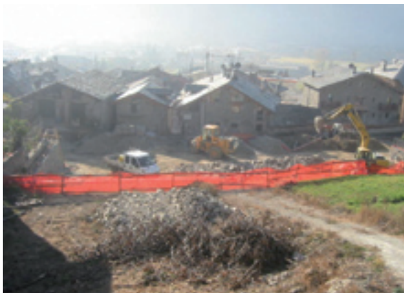
Autorimessa in località Meysattaz