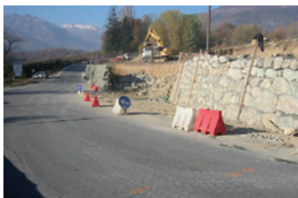
Rotonda in località Castello