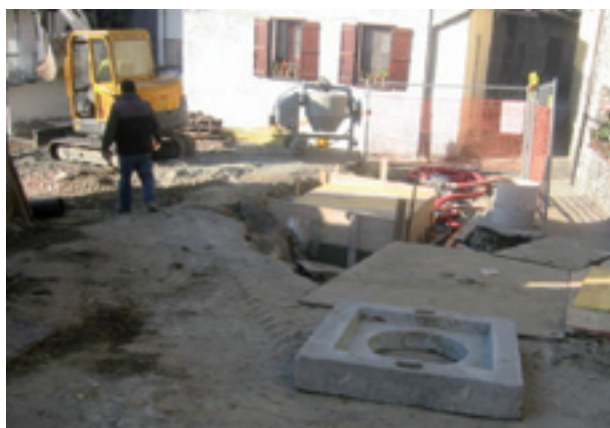
Acquedotto in località Bagnère